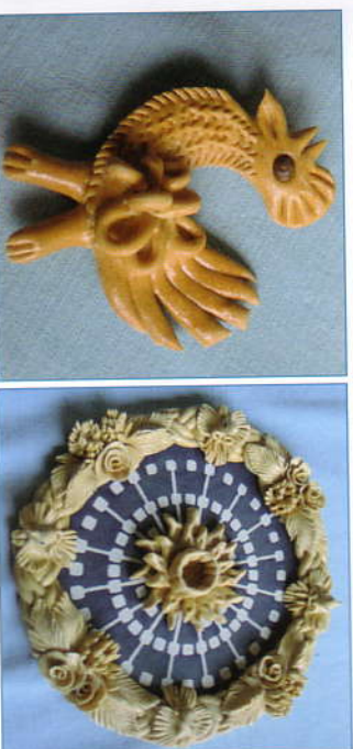
Ukázky vizovického pečiva

Za pěkného počasí jsou výhledy na Hostýněk, panorama Hostýnské vrchoviny, panorama Vizovické vrchoviny, Jasenná, Sýrákov, Vartovňa, Taněchice, Pozděchovské kostely.