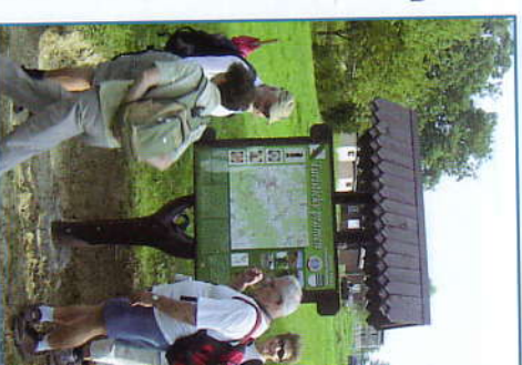
Turisté u zastavení naučné stezky č

Text a foto: Ing. Miloslav Vitek. Stezka i tato brožura vznikla díky organizačnímu úsilí Mgr. Aleny Hanákové, místostarostky města Vizovice.