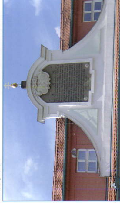
Štít nemocnice Milosrdných Bratří se starou lékárnou z r. 1781.