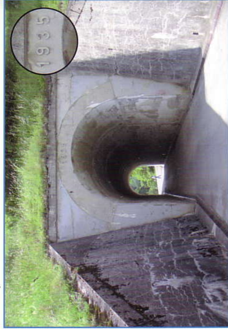
Podjezd pod tělesem nedokončené Baťovy železnice z roku 1935