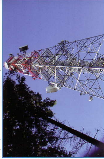
Rozhledna na Doubravě