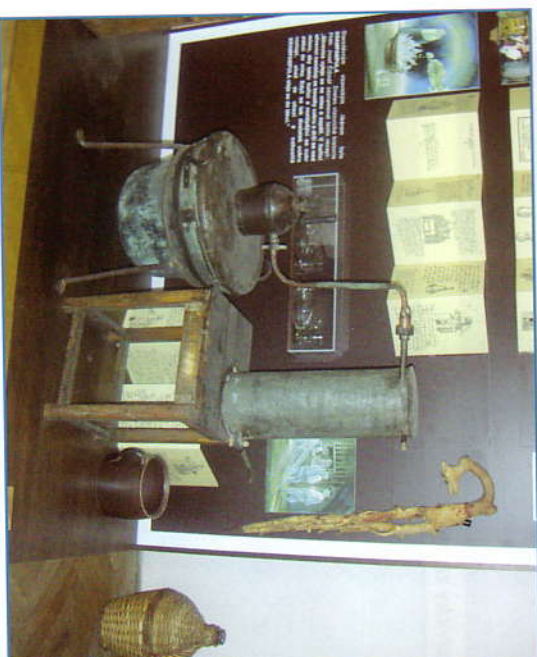
Ukázka expozice z Muzea slivovice ve Vizovících

V areálu R. Jelínka je Distillery Land a muzeum slivovice. Zde každoročně probíhá známá slavnost a kulturní akce Trnkobra