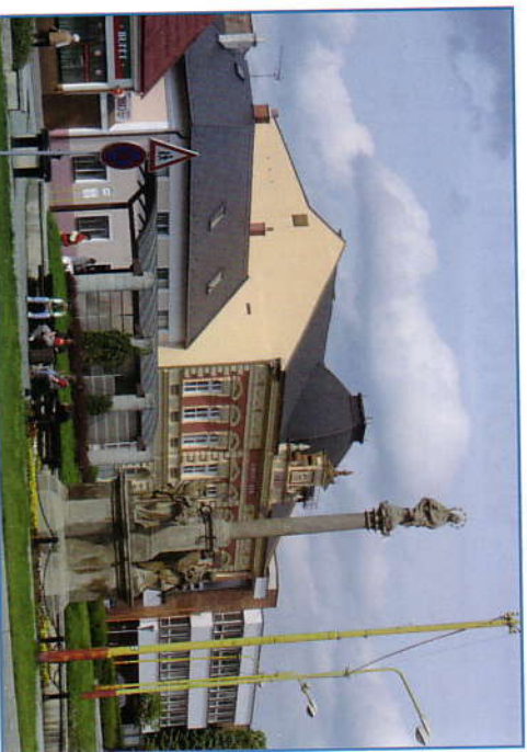
Mariánský sloup na Vizovickém náměstí

Vizovice – město s 4 500 obyvateli ležící na úpatí Vizovických vrchů. První písemná zmínka je z r. 1261 v zakládací listině cisterciáckého kláštera Rosa Mariae. Po jeho zániku byl na stejném místě postaven v 16. století zámek. V roce 1570 byly Vizovice povýšeny na město císařem Maximiliánem II. Dnes město s bohatými kulturními tradicemi, mnoha zajímavými kulturními a sakrálními památkami i významnými rodáky a osobnostmi.