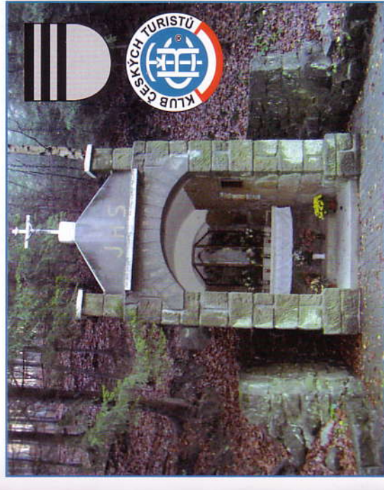
Zastavení číslo 3 - Chladná studna